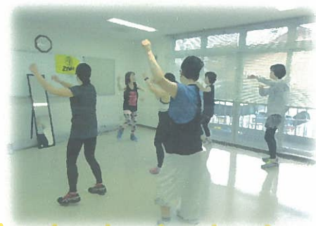
イメージ写真です。