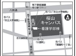
名古屋市立大学 桜山キャンパス 看護学部棟 3階 308 講義室

●都合により、日程、講師、内容等が変更となる場合がありますので、ご了承ください。