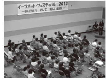
昨年のフェスティバルの様子