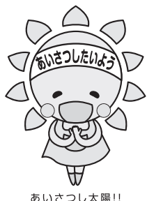
あいさつしたいばう!!