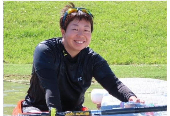
一般社団法人日本パラカヌー連盟より

NTP 名古屋トヨペット株式会社 岐阜県カヌー協会所属 パラカヌーワールドカップ出場 パラカヌー世界選手権出場 東京パラリンピック2020大会出場